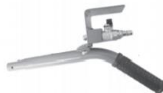
Spojovací tyč 2